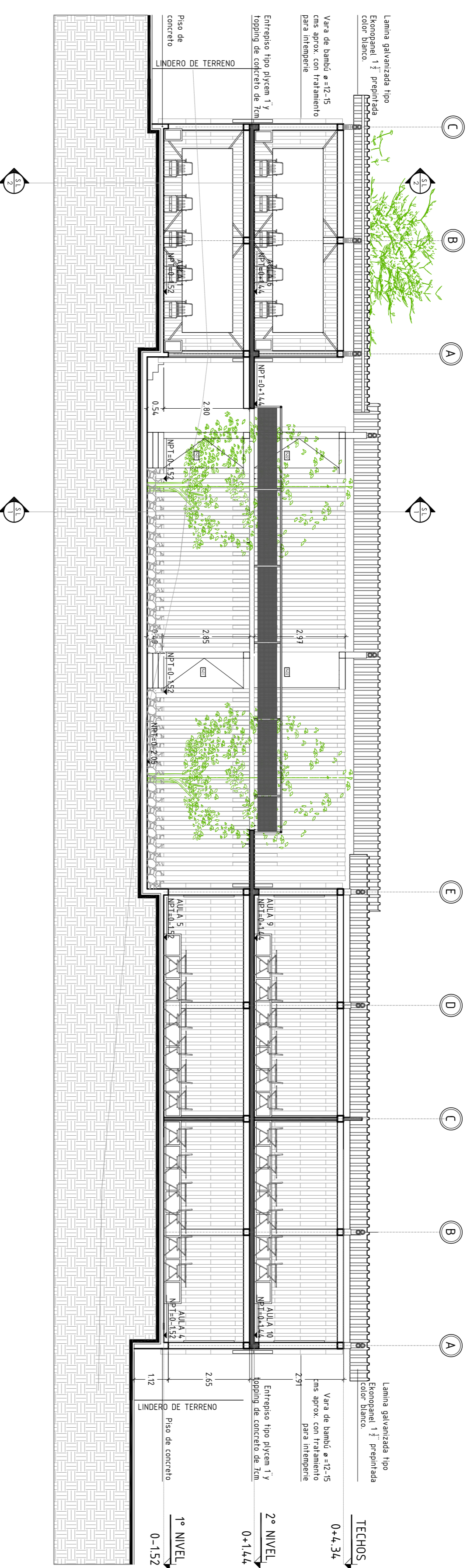
SECCIÓN TRANSVERSAL - 1